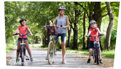
Gemütlich Radeln in der Au