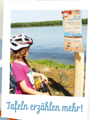
Tafeln erzählen mehr!